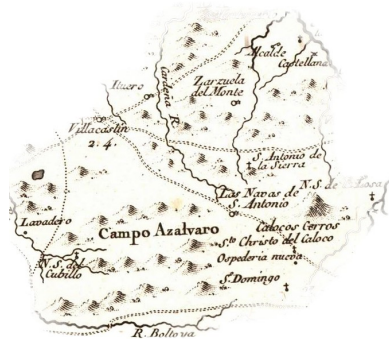
Mapa de Segovia de Tomás López, 1773

La primera referencia a las Navas de San Antonio es en documento de 1446. Se la conocía con el nombre de las Navas . Poco tiempo después, en 1455, hay referencias a la leyenda que dio lugar a la construcción de la ermita de San Antonio del Cerro, en la sierra de los Calocos.